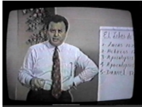
José Luis De Jesús

Creciendo en Gracia es un movimiento cuya sede se halla en la ciudad de Miami, en el estado de Florida, EE.UU. A primera vista parece ser un ministerio preocupado por la propagación de las doctrinas de la gracia y por la violencia e intimidación religiosa que ha caracterizado a los grupos pentecostales más extremistas. Su literatura y los mensajes grabados en cassettes en contra del legalismo y del sistema de obras o méritos para mantener la salvación, resultan sumamente atractivos para todos aquellos carismáticos desilusionados y hastiados de tanta inseguridad y doctrinas extremistas inventadas por los hombres. Para aquellos que están descarriados o descontentos, y que han comenzado a descubrir algunas verdades relacionadas con la seguridad eterna y el reposo soteriológico