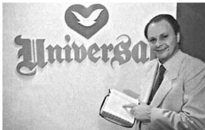
Obispo Edir Macedo (Iglesia Universal)